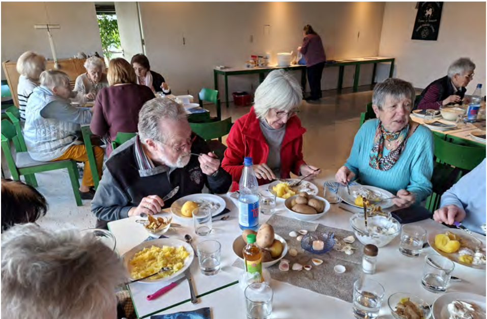
Im Altenkreis beim Heringessen.

Seien Sie herzlich eingeladen! (bitte unbedingt bei Frau Doelle anmelden) (Tel. 5908) oder bei Frau Dunker (Tel. 82451).