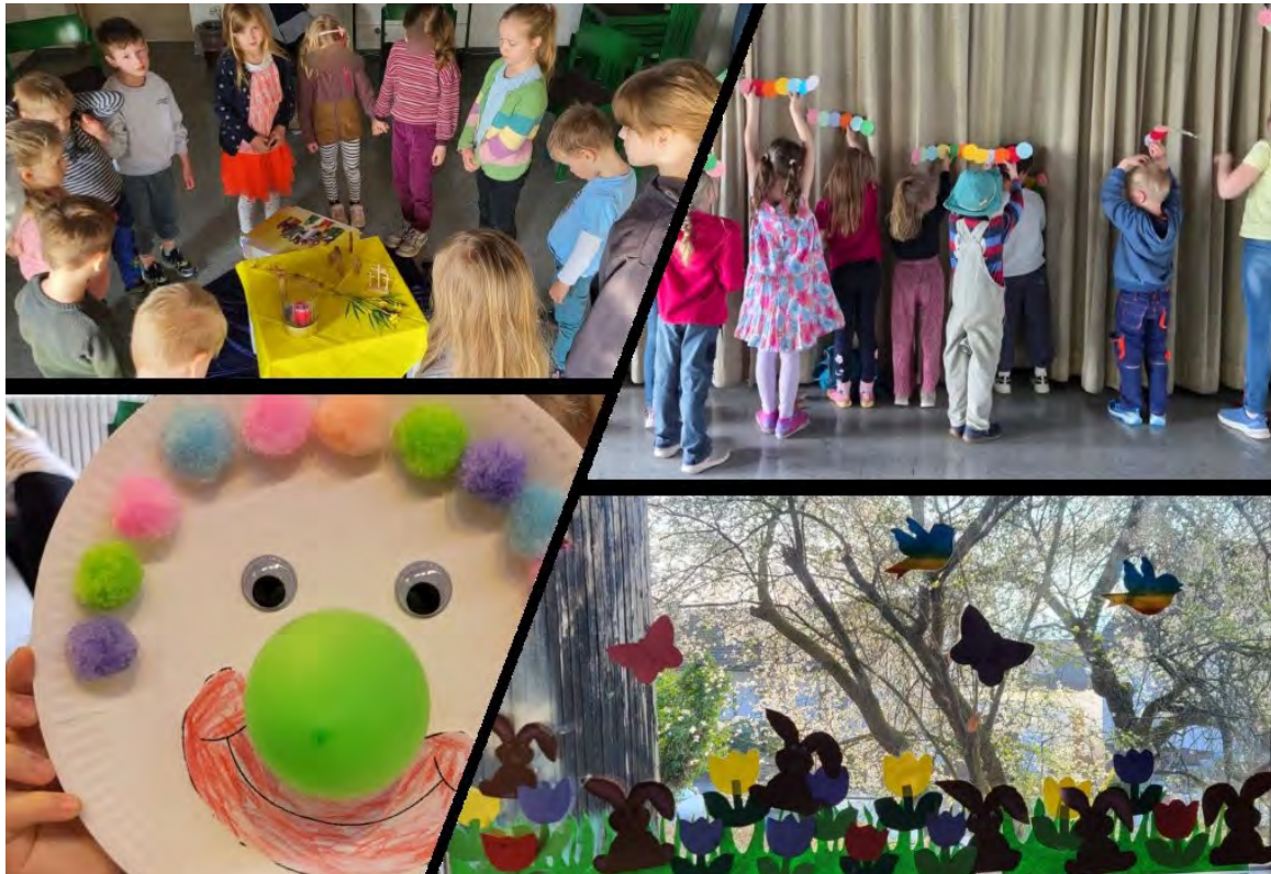
Bild: Eindrücke von der KiKi - Kinderkirche: bunt und heiter.